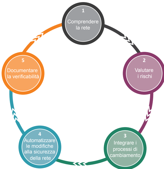
I 5 elementi essenziali alle modifiche della sicurezza della rete

La maggior parte delle modifiche della rete dipendono dai requisiti delle applicazioni e della connettività della rete stessa. Data la complessità delle reti aziendali odierne, ogni modifica può rappresentare una minaccia per la sicurezza e la continuità delle operazioni. Inoltre, secondo gli standard normativi, è indispensabile giustificare e motivare tutta la connettività della rete. Tutte le modifiche applicate alla sicurezza della rete devono perciò essere verificabili, oltre che affidabili. Prepararsi e superare le verifiche può risultare altamente dispendioso, a livello di tempo e di risorse. Naturalmente è opportuno integrare una gestione delle modifiche alla sicurezza della rete con i processi di automazione informatica aziendali.